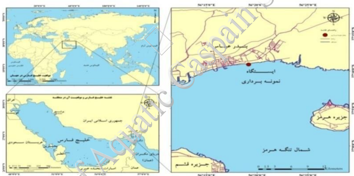
شکل ۱- موقعیت جغرافیایی منطقه نمونه‌برداری

منطقه نمونه‌برداری با طول و عرض جغرافیایی 56^{\circ} 19' 21.94'' E ، 27^{\circ} 10' 59.34'' N در جنوب استان هرمزگان و در پساحل شهر بندرعباس قرار دارد (شکل ۱). نمونه‌های خرچنگ منزوی Diogenes avarus به تعداد مورد نیاز و به صورت تصادفی در زمان جزر از ساحل خواجه عطا بندرعباس نمونه‌برداری شدند و با کمترین استرس به آزمایشگاه منتقل شدند.